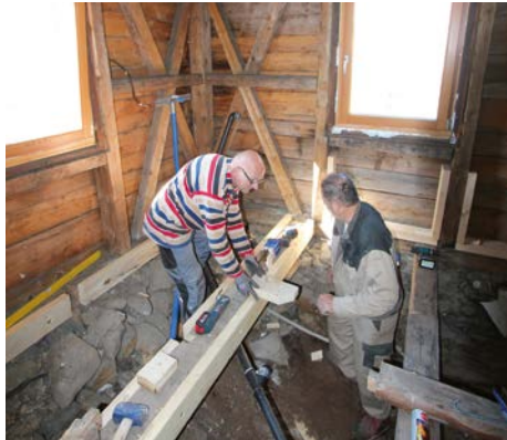
Alles muss neu!