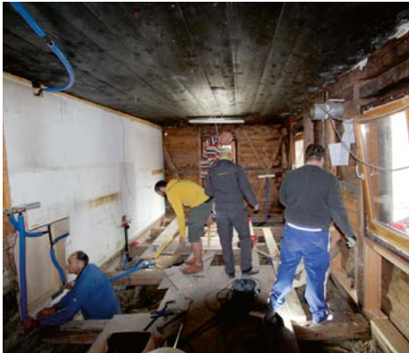
Alles muss raus! Platz schaffen für die neue Küche