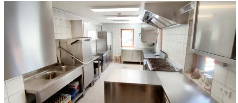
Nun ist die Küche fertig dank eure Spenden und tatkräftiger Unterstützung!