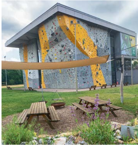
Unter dem Sonnensegel lässt sich gut chillen.